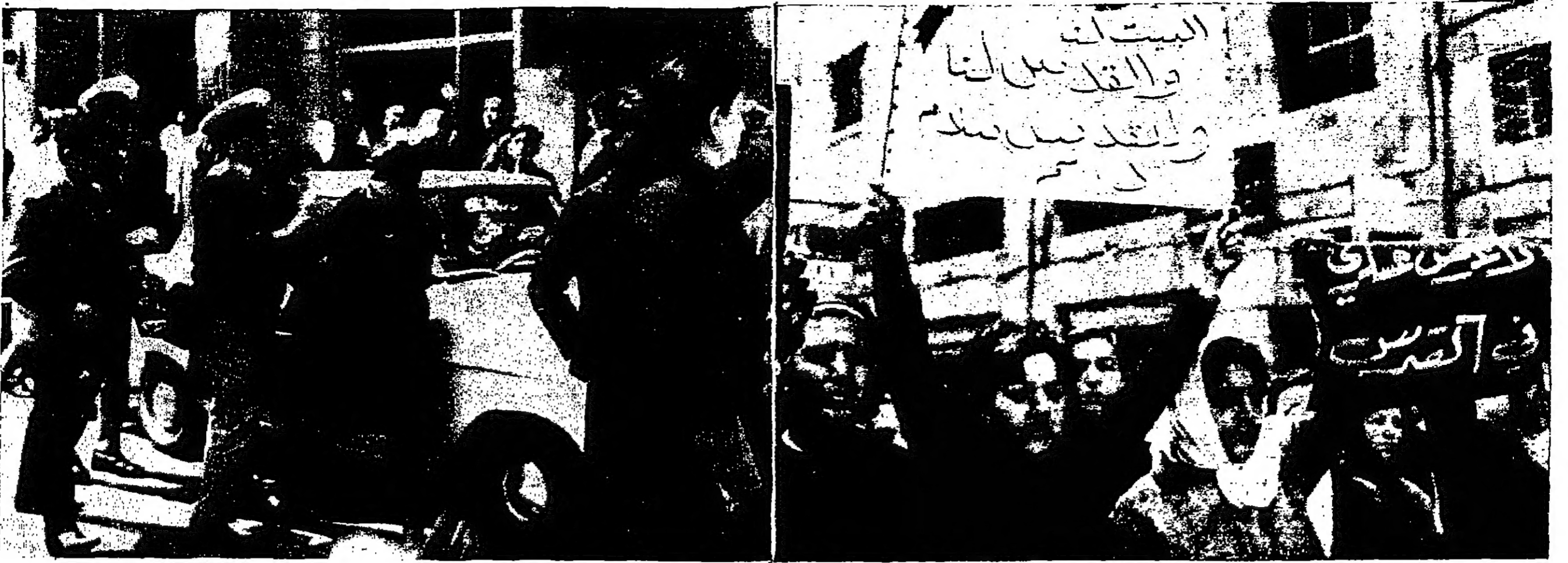
من مشاهد المظاهرة التي قامت بها المرأة العربية في القدس يوم امس الاول احتفالات العرض العسكري الإسرائيلي في القدس العربية وترى بعض الاشتراكيين المظاهرة يحمان لافتات الاستقلال والعرض ولكن عروبة القدس بينما تحمل الصورة ايجابية وحشية الجيش الإسرائيلي ضد احدى السيدات الاشتراكيين المظاهرة (صور اخرى ص ٢)

احتفالات في القدس القدس المحتلة - وال - تيسد القليل من المظاهرة النسائية الكبيرة التي قامت بها نساء القدس العربيات يوم امس الاول احتفالا على العرض العسكري الذي شوي اسرائيل قبلته في الحنية القوية ان اقسام العربيات كن يرمن في المظاهرة لافتات كتب عليها العبارات التالية : البيت لنا والقدس لنا ، والقدس الحقة على الضفة السابعة عود ١